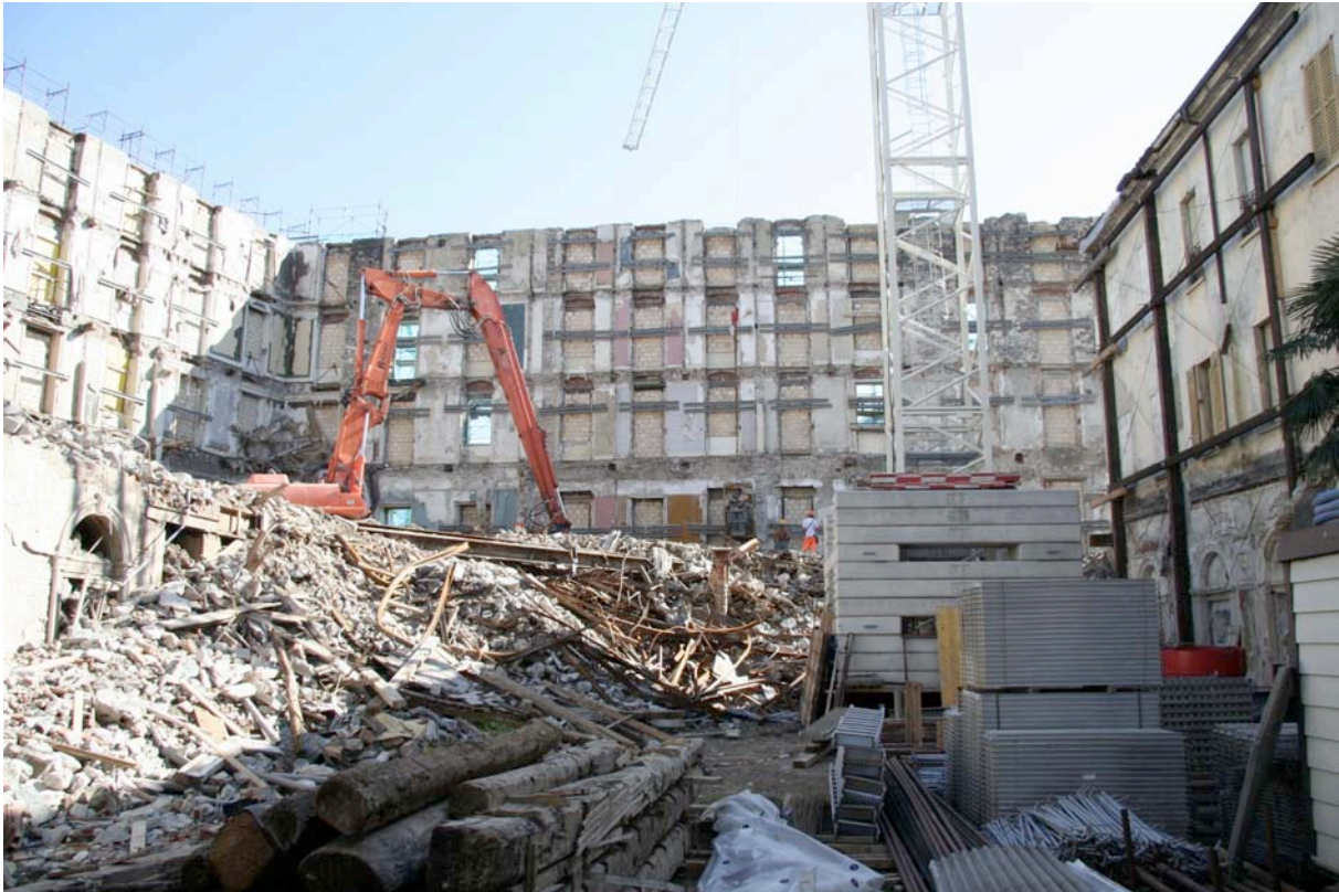
Lugano: Albero Palace, 2006 (Bernhard Furrer, 158.61)