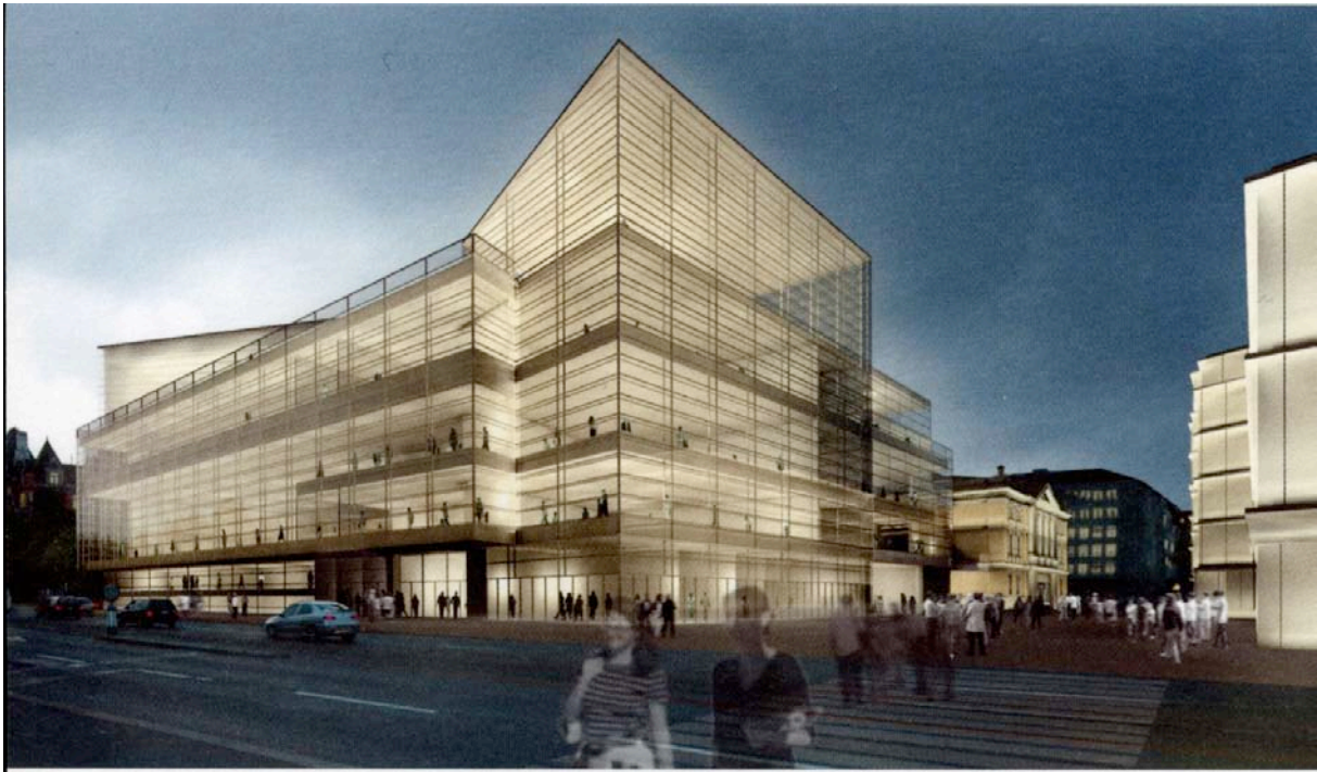
Zürich: Kongresshaus Projekt Raffael Moneo