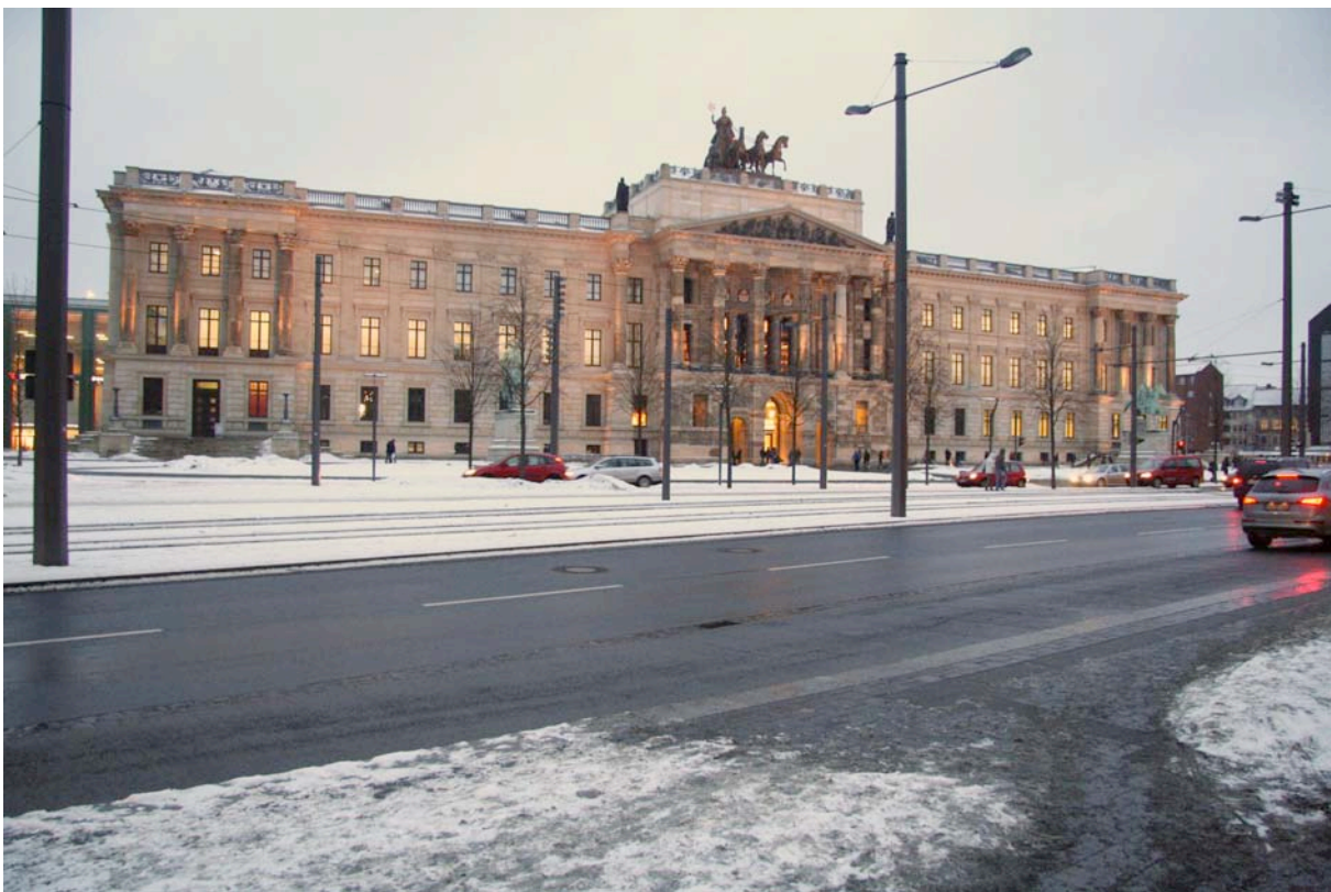
Braunschweig: Schlossfassade 2008 (Bernhard Furrer, 2115.12)

Die Rekonstruktion abgebrochener Bauten ist nicht immer und überall auszuschliessen. Ein rekonstruiertes Gebäude ist indessen kein Zeugnis des abgegangenen Baus, sondern ein Zeugnis mangelnden Vertrauens in die Qualität heutiger Architektur. Es ist zudem Ausdruck der Sehnsucht nach der vermeintlichen Unversehrtheit früherer Zeiten, nach dem schönen Bild. Die Aufgabe der Denkmalpflege besteht darin, die Zeugnisse vergangener Zeiten zu bewahren und zu pflegen; Rekonstruktionen gehören nicht dazu. Aufgabe der Architekten ist es, sich ungebührlichen Rekonstruktionen zu widersetzen.