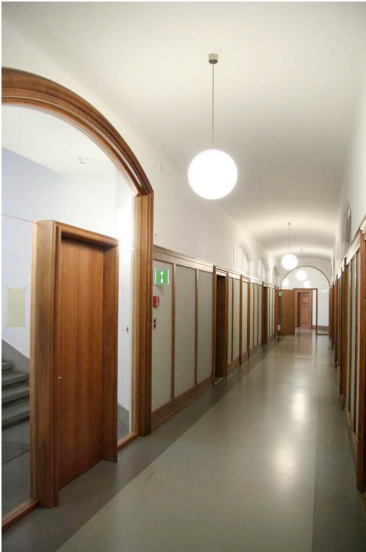
Zürich: Stadthaus IV, Gustav Gull, 1917-19 – Umbau Elisabeth und Martin Boesch, 2004 (Bernhard Furrer, 1357.19)

zeitgenössischen Leistungen, zu Zeugnissen heutiger gesellschaftlicher Verhältnisse und Veränderungen.