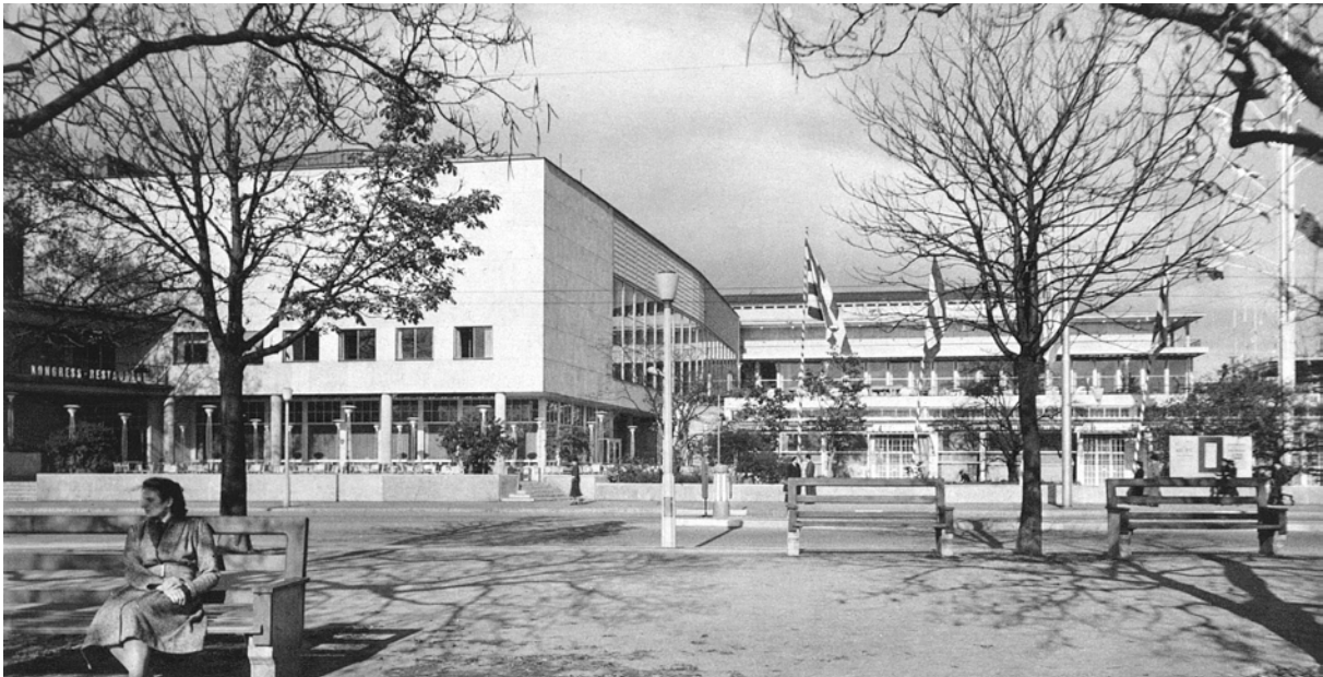
Zürich: Kongresshaus Bestand

Es geht beim Baudenkmal folglich um wesentlich mehr als um gute oder gar hervorragende Architektur. Der geschichtliche Zeugniswert des Denkmals in all seinen Facetten kann selbst dann nicht aufgewogen werden, wenn der Ersatzbau von höchster gestalterischer Qualität ist.